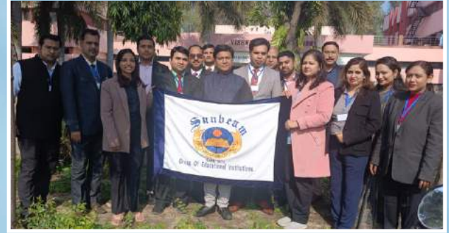
MEET & GREET WITH MS. DEEPTI NAVAL @ BANARAS LITERARY FESTIVAL