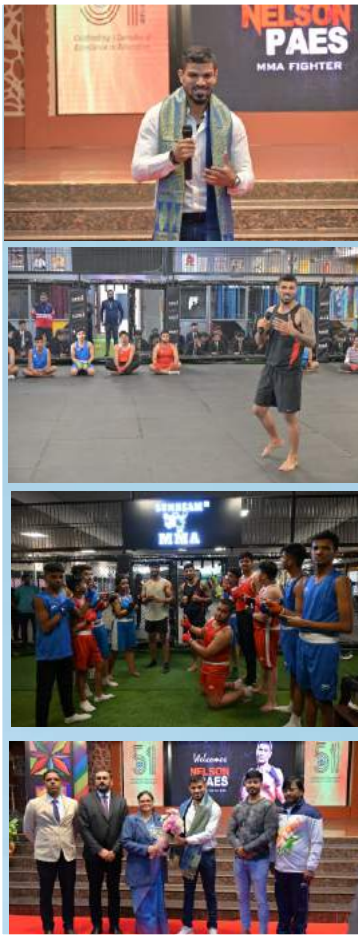
MMA TRAINING BY NELSON PAES, INTERNATIONAL FIGHTER & TRAINER