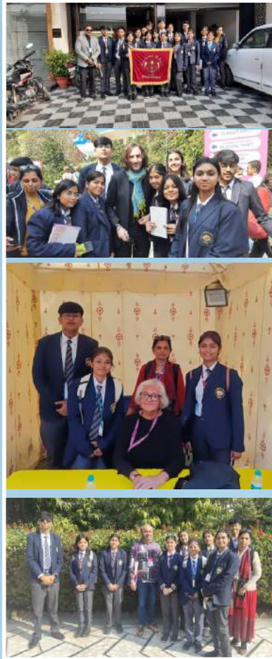
SUNBEAMS @ JAIPUR LITERATURE FEST