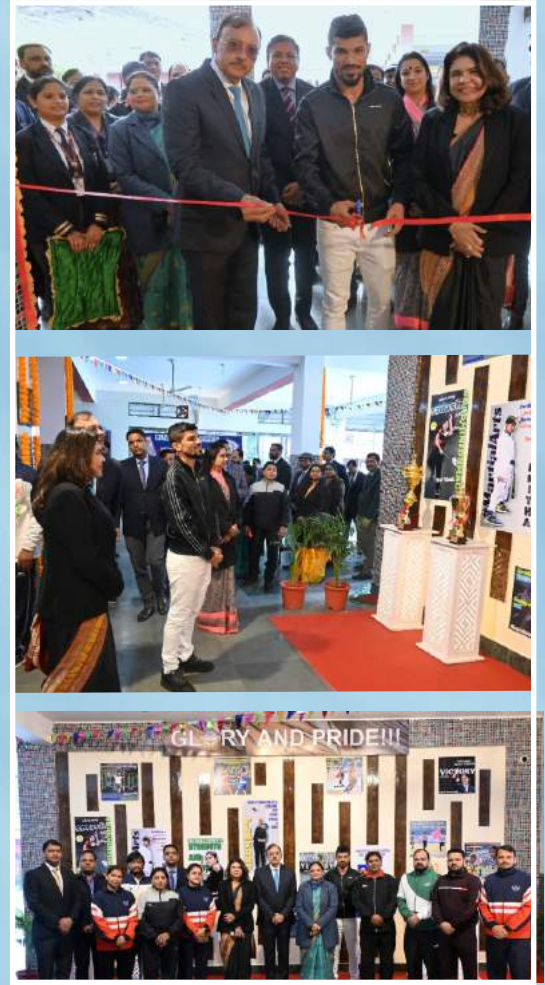
INAUGURATION OF SUNBEAM BHAGWANPUR SPORTS GALLERY