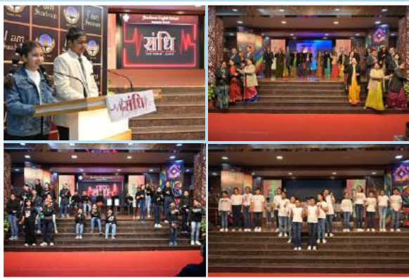
SANDHI - FAREWELL @ CLASS VI